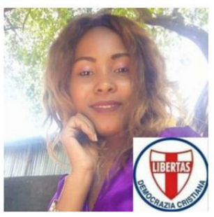
A cura della Dott.ssa CLEMENTINE HENRIETTE

yenny.gonzales@dconline.info) ha inteso formulare alla nuova Dirigente della D.C. in Georgia i più cordiali auguri di <Buon lavoro > e di < Buona D.C. >!